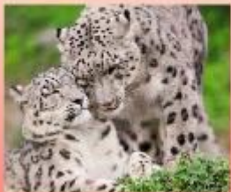
Снежный барс (ирбис)