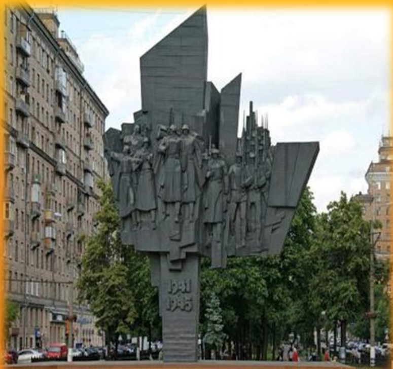
Монумент- «Защитники Москвы»