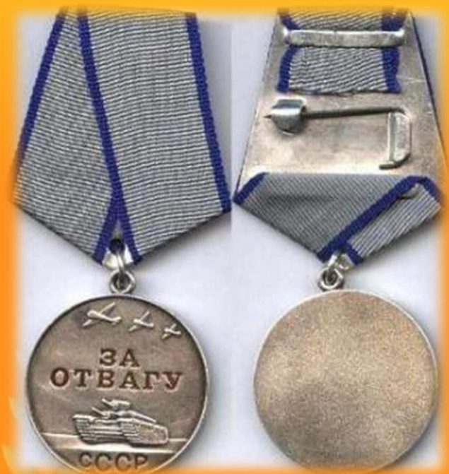
Медаль за отвагу

За героизм и подвиги на войне, солдаты награждались орденами и медалями.