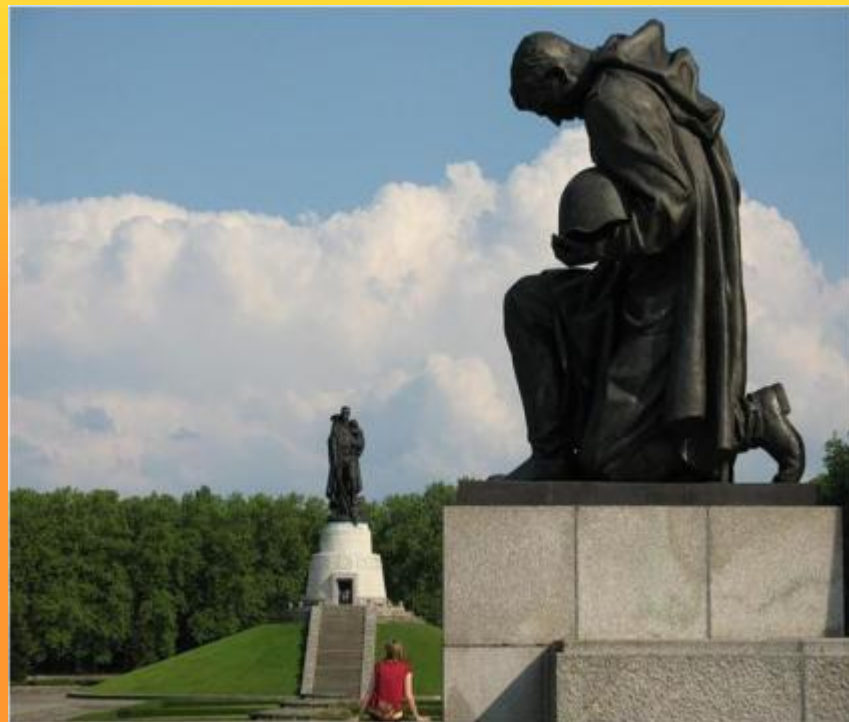
Памятник воинам Советской Армии павшим в боях с фашизмом.