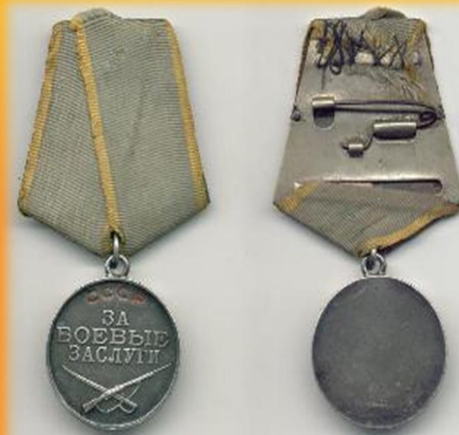
Медаль за боевые заслуги