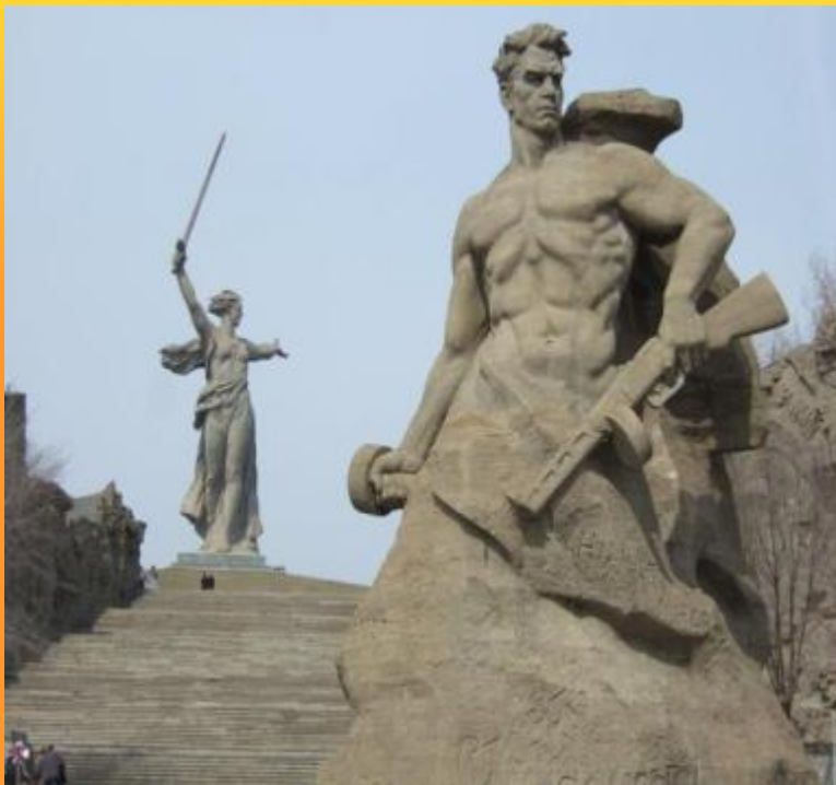
Мамаев Курган в Волгограде Монумент-