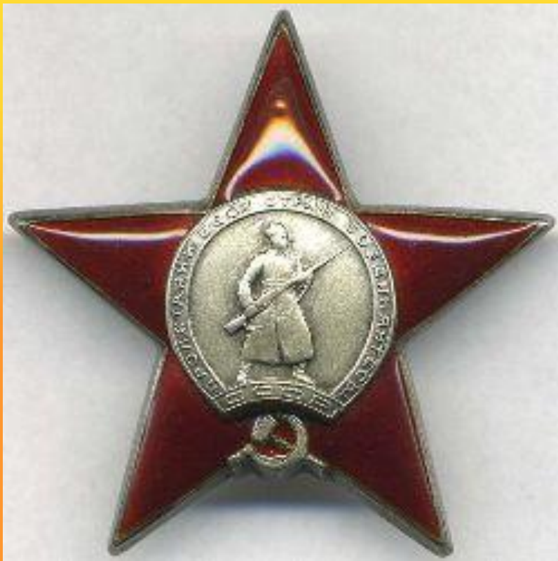
Орден красной звезды