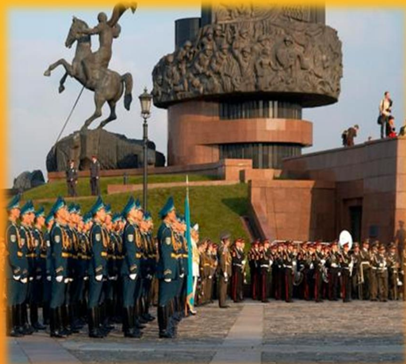
Поклонная гора в Москве