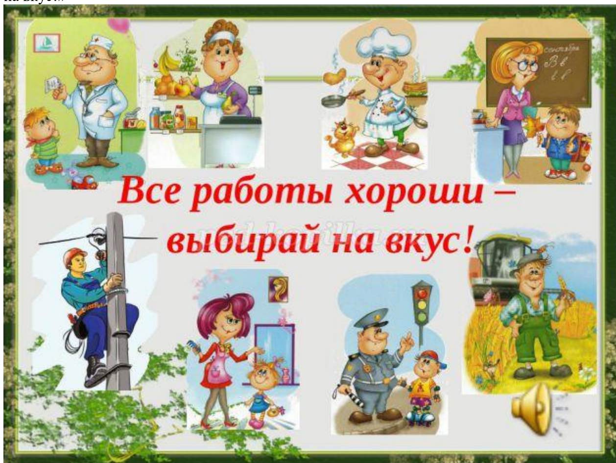
Выставка книг по теме "Профессии"