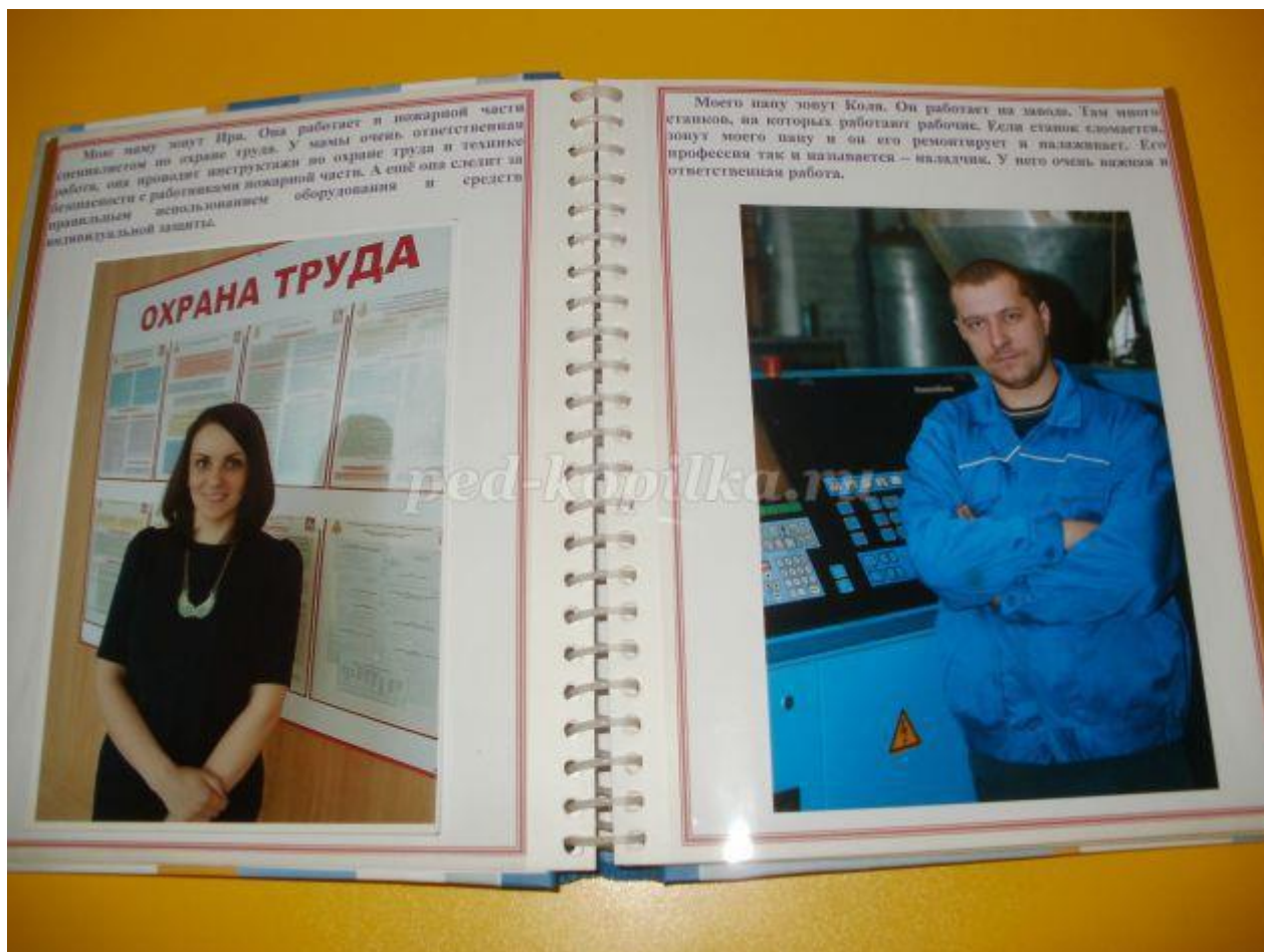
Конкурс рисунков "Моя мама на работе"