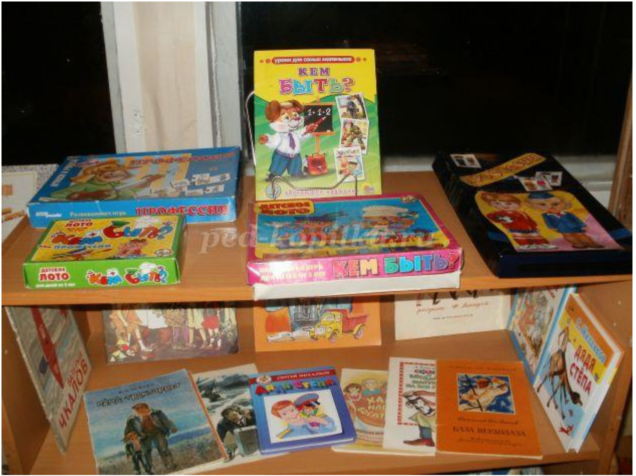
Дидактические игры на тему "Профессии"