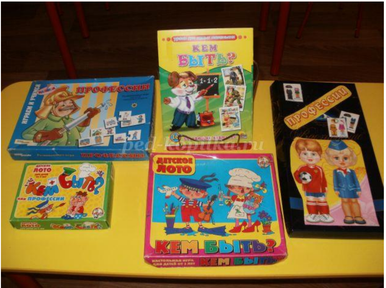
Игра "Угадай профессию"