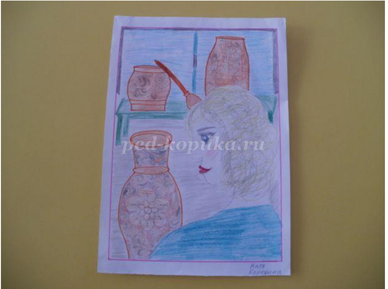
ООД по лепке "Поможем испечь кондитеру пирожные"