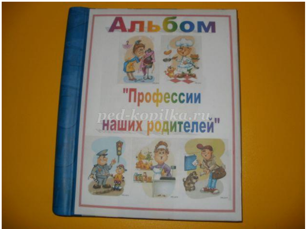
Папа и мама на работе